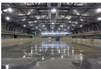
Regionales Eissportzentrum Emme, Burgdorf zinsloses Darlehen, Bereich innovative regionale Angebote

Nachstehend einige Beispiele geförderter Projekte im Emmental seit 2008: