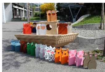
Spiel dich durch Langnau Projektbeitrag à fonds perdu, Bereich Tourismus