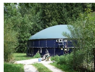
Förderung Biogasanlagen mit Hofdünger Projektbeitrag à fonds perdu Bereich Cleantech

Eine Übersicht aller unterstützten Projekte sowie weitere Informationen finden Sie unter www.regionemmental.ch , Bereich Regionalpolitik.