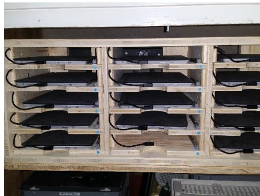
15 Tablets Surface 3 am Aufladen