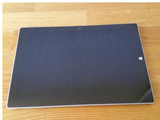
Abnehmbare Tastatur – flexibler Einsatz