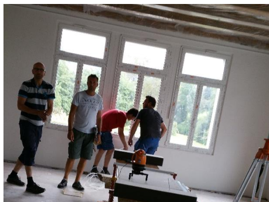
Straffe Planung in den 6 Wochen