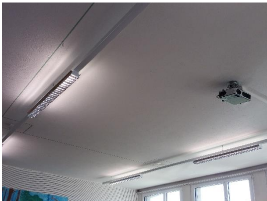
Helle, freundliche Unterrichtsräume

Die 15 alten Notebooks, die nur mit dem veralteten Windows-XP betrieben werden konnten(!), haben wir in Zusammenarbeit mit der Firma Powernet, Oberburg mit 15 Microsoft-Tablets Surface 3 ersetzt. Die nötigen Kredite von Fr. 15'000.00 waren im Budget 2016 eingestellt. Nun können die Ersteler bis Sechsteler die ortsunabhängigen Geräte für Lernprogramme, Suchaufträge oder im Fremdsprachenunterricht nutzen. Einen Teil des internen Netzwerkes haben wir heuer unplanmässig ersetzen müssen, den Rest werden wir in Zusammenarbeit mit der Firma Elektro Christen wie geplant 2017 anpassen.