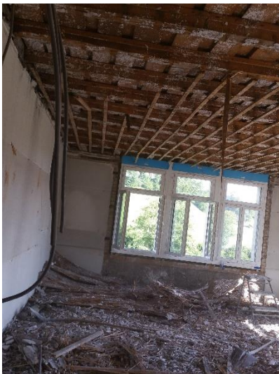
Schutt und Staub zum Starten ...

Am Samstag, 03. Dezember 2016 kann das Schulhaus nach der Gemeindeversammlung besichtigt werden.