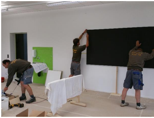
Schöne, moderne Unterrichtszimmer entstehen.