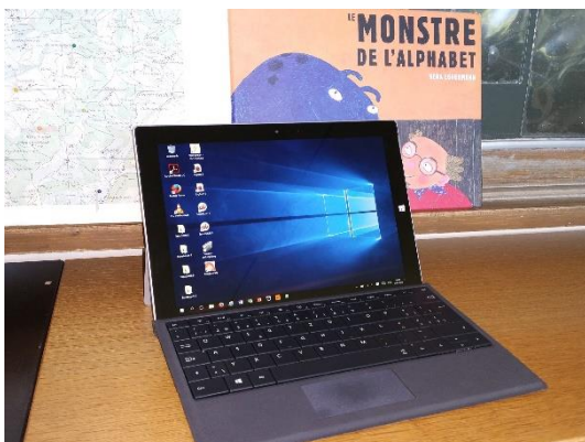
Unsere Lernprogramme sind gespeichert.