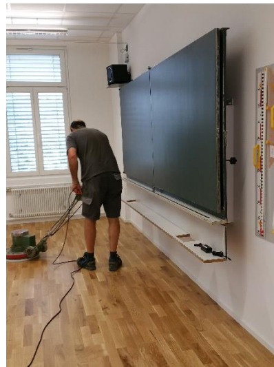
... dann der Finish.